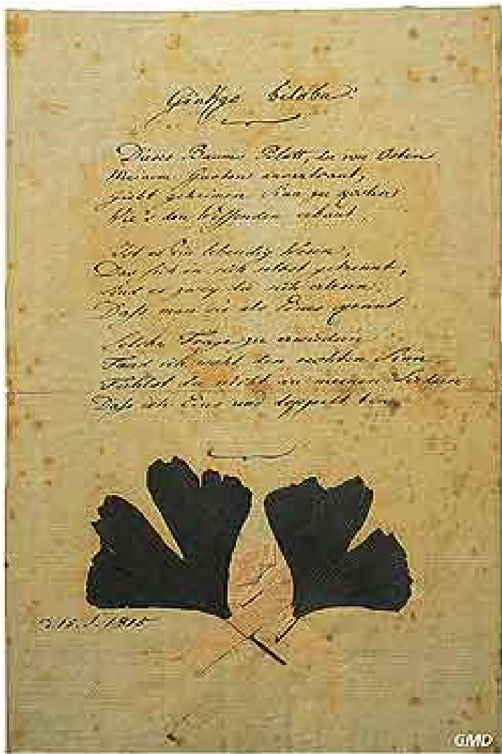
Goethe. Manuscrit du poème »Gingko biloba« avec deux feuilles séchées de gingko. 15 septembre 1815.

Une vitrine renferme des projets manuscrits de Goethe pour des scènes du „Faust II“ et des essais de versification pour l'acte d'Hélène par son