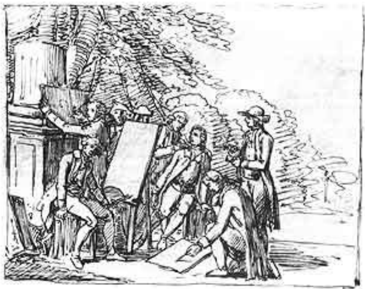
Goethe entouré de ses amis à Rome. Dessin à la plume de Friedrich Bury. 1786.

„Faust“ est l'oeuvre qui occupa Goethe toute sa vie. Pour montrer dans quelle tradition s'inscrit Faust, une salle distincte est réservée à ce thème: le visiteur peut suivre l'évolution de l'histoire de Faust, des livres populaires à la première oeuvre dramatique de Marlowe, de la tradition des marionnettes aux adaptations postérieures à l'oeuvre de Goethe. La collection Faust du musée Goethe réunit une impressionnante documentation sur l'exploitation artistique du thème dans la littérature, les arts plastiques et la musique.