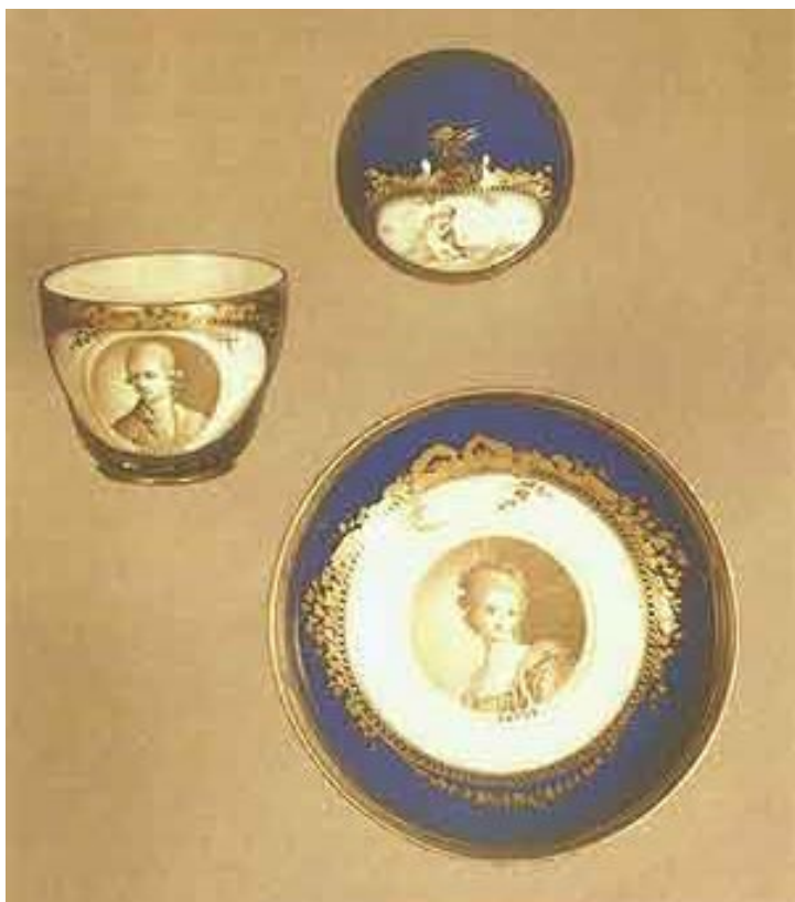
Une tasse en porcelaine de la manufacture de Meissen avec: les portraits de Werther et Lotte.