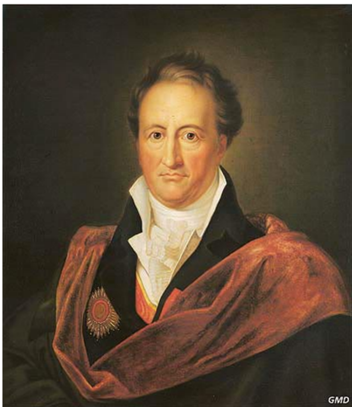
Goethe. Portrait par Franz Gerhard von Kügelgen. 1810.