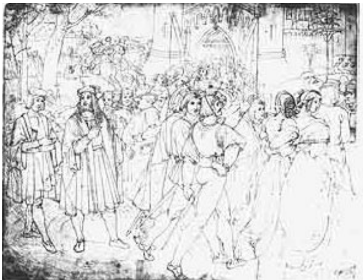
»Devant la porte«. Dessin au crayon et à l'encre de Peter Cornelius. Illustration pour »Faust II«. 1811.

L'abondance des charges acceptées au cours des années menaçait d'étouffer l'oeuvre poétique de Goethe, c'est pourquoi il obtint du Duc Carl August un congé illimité et parti pour l'Italie en septembre 1786. Il espérait de ce voyage une régénération. Il la ressentit si intensément qu'il put écrire dans la première lettre qu'il adressa de Rome à sa mère: „je reviendrai un homme nouveau et ma vie sera désormais source de joie plus grande tant pour moi que pour mes amis.“ Cette lettre exposée dans une des premières vitrines des salles consacrées au voyage en Italie, au premier étage du musée. Dans une autre vitrine, la version définitive de la Vème Elégie Romaine que Goethe offrit à Fritz Jacobi nous montre combien il se sentait „transporté sur la terre classique.“ Pour Goethe l'esprit et l'art des formes de l'Antiquité prirent vie dans un cercle d'artistes allemands débordant de joie de vivre. Un dessin à la plume du peintre Fried-