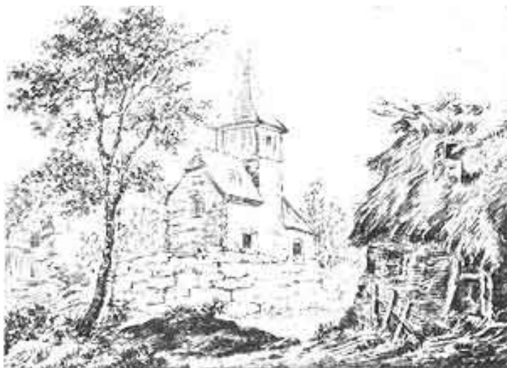
Goethe. L'église de Ehringsdorf. Dessin au crayon et à la plume (vers 1778)

Madame von Stein joua un rôle essentiel dans cette évolution spirituelle au cours du premier séjour de Goethe à Weimar. Sa silhouette et un billet, trace de l'échange animé d'informations qu'elle entretenait avec Goethe,