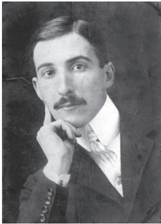
Porträt Stefan Zweig Foto, Privatbesitz